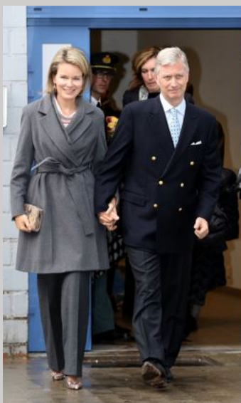
Koningin Mathilde en koning Filip.

Met het kerstconcert bedanken de koning en de koningin iedereen die hen het aflopende jaar heeft geholpen bij hun werk. Het gebeurt zelden dat de koninklijke familie voltallig opdaagt. Maar het is ongezien dat alleen de koning en de koningin er zijn. Vorig jaar bijvoorbeeld waren ze nog vergezeld door Claire en Astrid.(dhs)