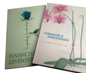
→ Financiële zorgvragen: in goede en kwade dagen, uitgeverij Mijwboek.be, nu in de rekken.

- Ouders hebben de keuze om zelf bewindvoerder te worden, of een externe partij aan te stellen.